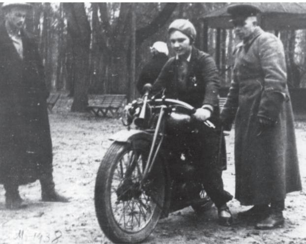
1941 г. Подготовка партизан к диверсионной работе в парке академии.

Справа от него находится памятник почвоведу В.Р. Вильямсу. Раньше там был вход в парк, который в то время назывался Парком культуры и отдыха имени Тимирязева. Молодые люди входили туда: одни записывались добровольцами, другие шли по призыву. К концу дня приехали военные, устроили там сборный пункт, развернули полевую кухню и начали первичное обучение стрельбе и медицинской подготовке — перед отправкой на фронт.