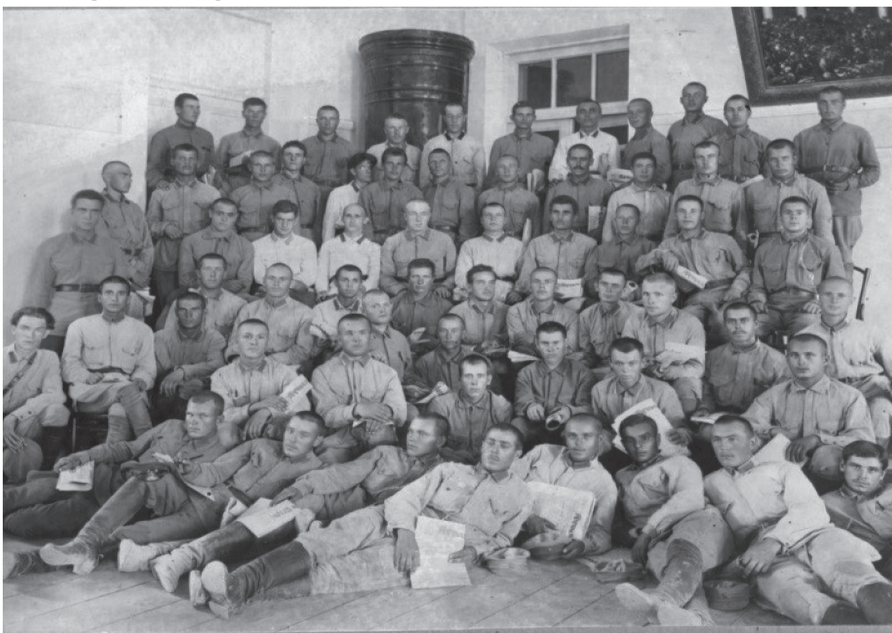
Военнослужащие, находившиеся на излечении в госпитале ТСХА.

В географическом центре Тимирязевки находится стадион. В октябре 1941 года, во время одной из бомбардировок Москвы, все здания стадиона сгорели. А с 25 мая по 3 июня 1945 года у стадиона фронт расквартирован Сводный полк Карельского фронта. Личный состав размещался в зданиях МСХА — этому полку предстояло участвовать в Параде Победы на Красной площади. Репетиции проходили прямо на стадионе академии на Верхней аллее, где были выстроены макеты Мавзолея и зданий Красной площади.