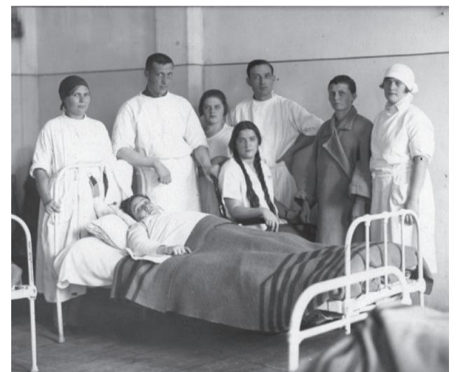
Служащие и раненные в госпитале ТСХА

В одних корпусах на излечении находились офицеры среднего звена, в других — высшего, в третьих — рядовые. Среди тех, кого выходили в стенах этого госпиталя, были прославленные военачальники: Константин Рокоссовский, Андрей Ерёменко, Николай Берзарин, Дмитрий Лелюшенко.