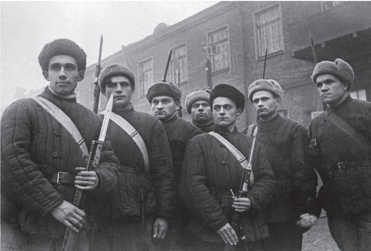
Студенты истребительного батальона во дворе здания академии 1941 г.

В истории становления отечественной агрономии Российский государственный аграрный университет – МСХА имени К.А. Тимирязева (исторически — Петровская Земледельческая и Лесная Академия) сыграл ключевую роль, став уникальным научным центром с полностью автономным хозяйством.