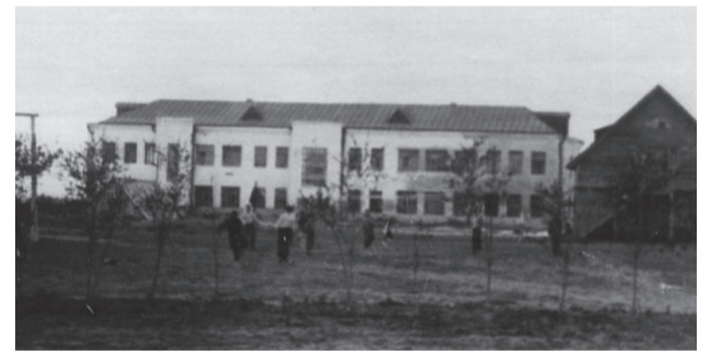
Стадион МСХА. 1940 г.

Во дворе Института мелиорации в годы войны находились мастерские, где занимались изготовлением прицелов для снайперского оружия. Изделия отправляли на передовую, в партизанские отряды, затем — в осажденный Сталинград. Готовили как оптику, так и комплектующие, чинили приклады и стволы огнестрельного оружия.